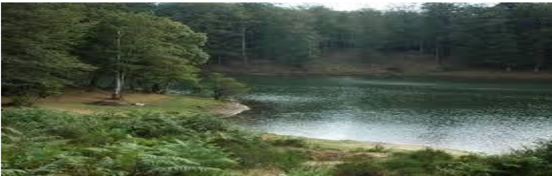
Altopiano dello Zomaro