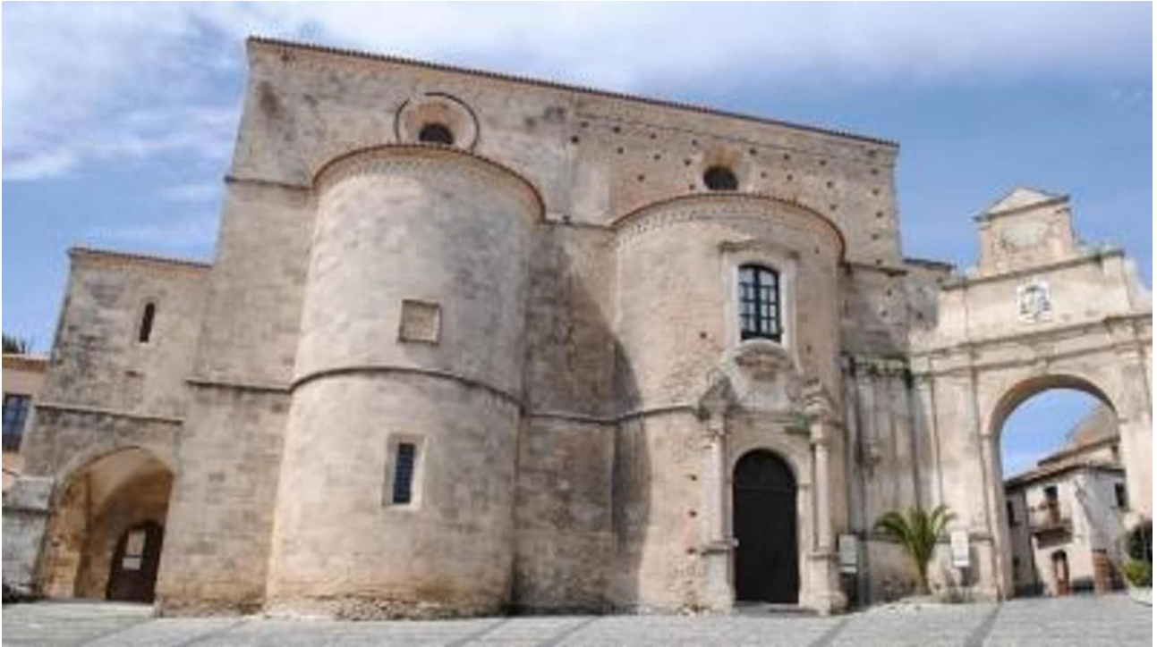
Gerace, la Cattedrale