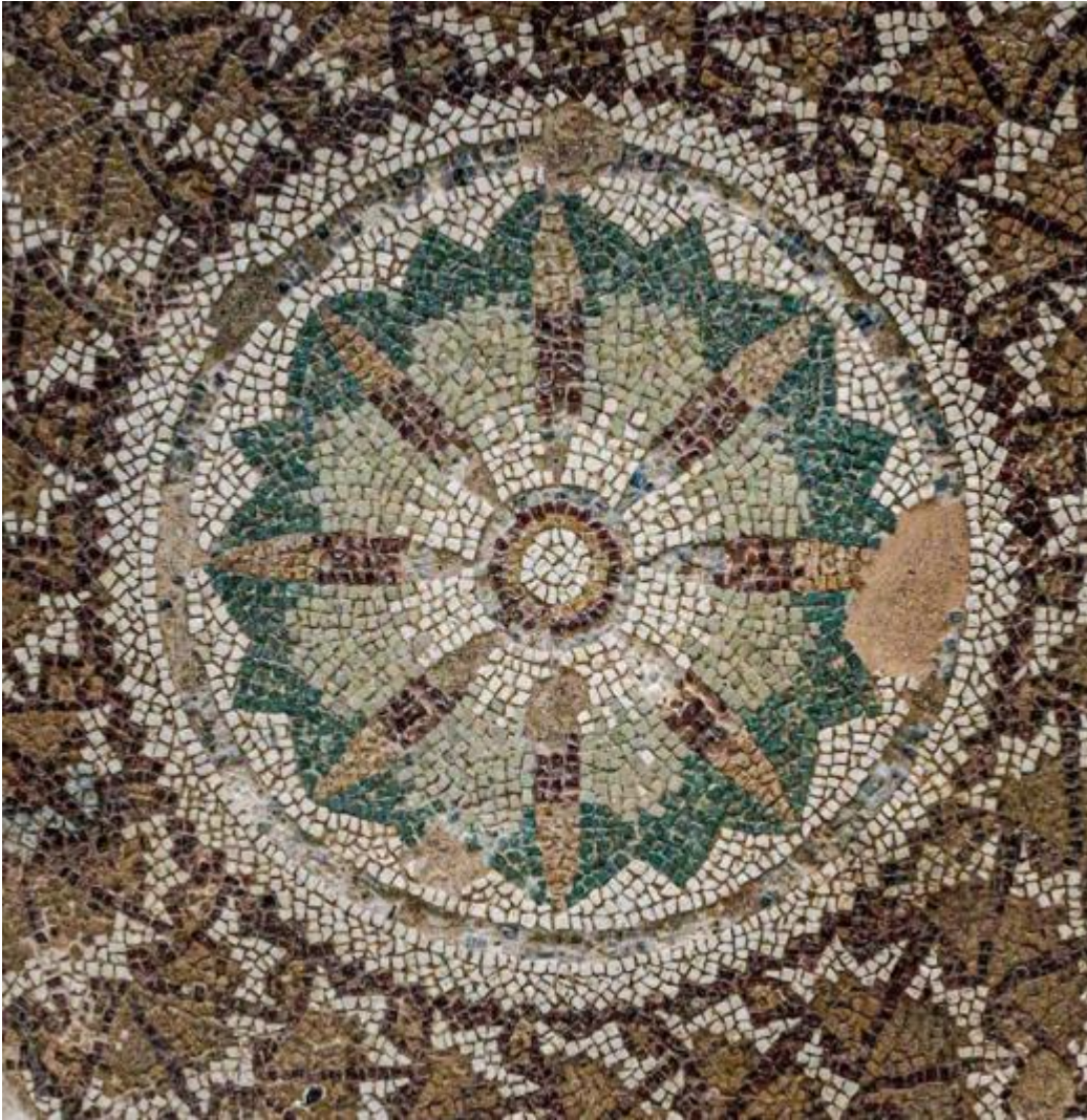
Villa romana di Casignana