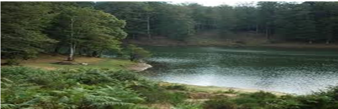
Altopiano dello Zomaro