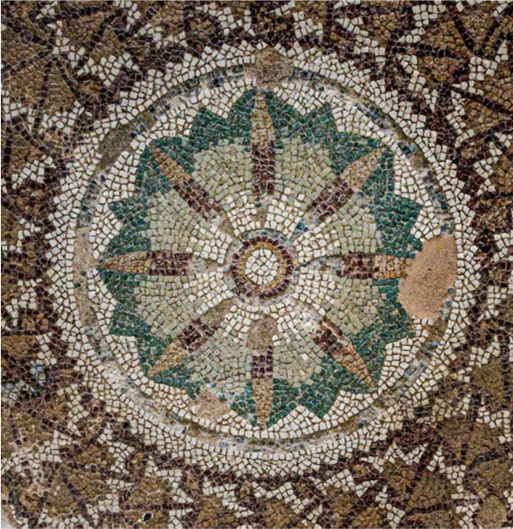
Villa romana di Casignana