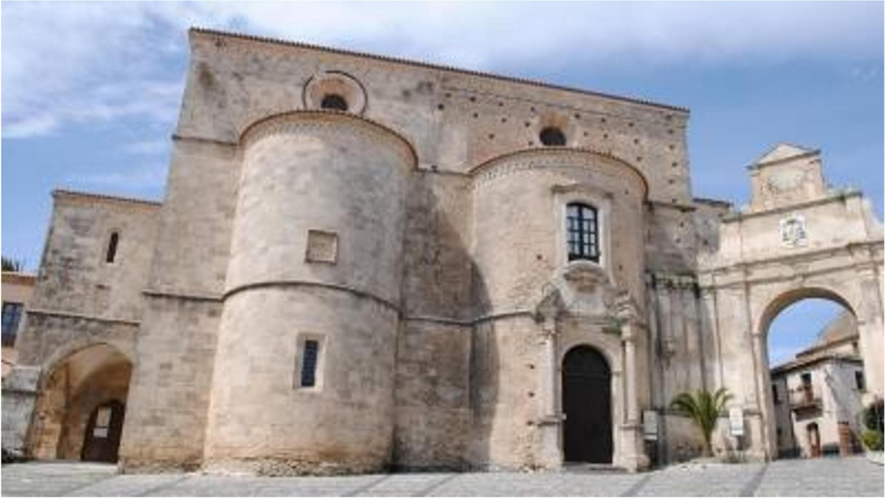
Gerace, la Cattedrale