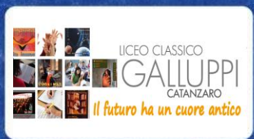
Illustrazione e progetto grafico: Valérie Scarpino